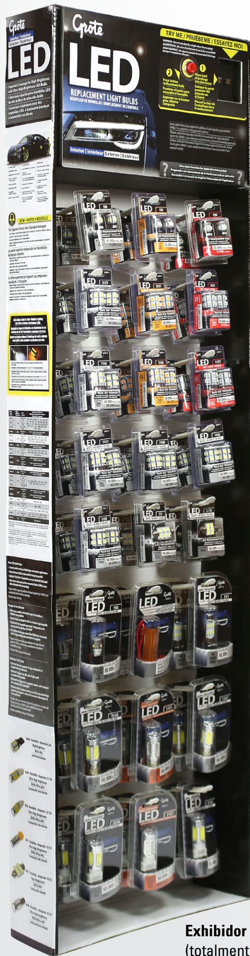
Exhibidor 00110 (totalmente cargado)