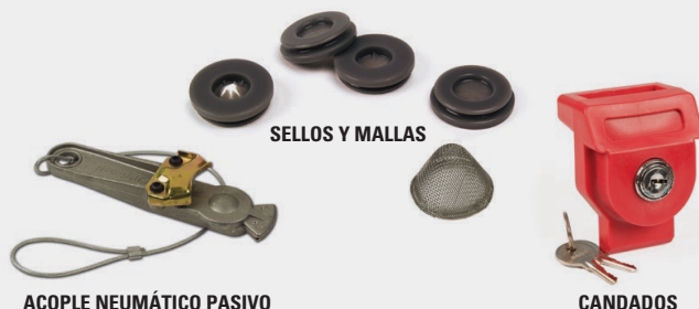
SELLOS Y MALLAS

Grote ofrece una línea completa de sellos de repuesto disponibles en goma y poliuretano. Estos económicos productos son indispensables como piezas de servicio donde sea que vaya. Los accesorios del acople neumático como los acoples neumáticos pasivos y tapones ofrecen protección adicional de los objetos evasivos que obstruyen sus líneas cuando su camión o remolque no está en funcionamiento. Además, la protección contra robo es muy importante, así que aproveche el candado del acople neumático de Grote.