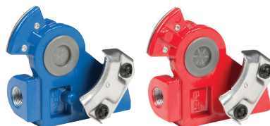
À ANGLE DE 38°